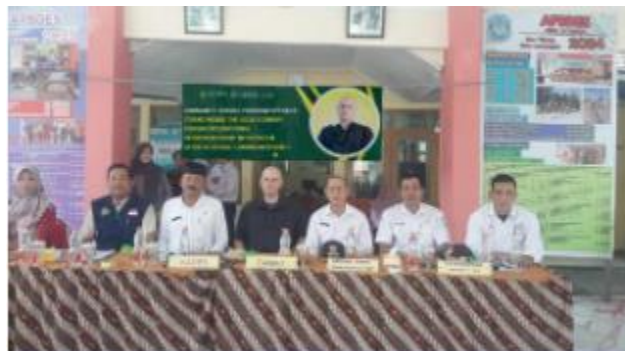
Gambar 1. Pelaksanaan FGD di Desa Jatirejo

Program pengabdian masyarakat ini membantu pertumbuhan ekonomi dan kemandirian masyarakat Desa Jatirejo. Seminar kewirausahaan ini bertujuan untuk memotivasi dan mendorong para pelaku usaha di desa dengan pengetahuan praktis. Seminar kewirausahaan ini membantu para pelaku usaha di Desa Jatirejo, Kabupaten Lamongan untuk lebih memahami potensi dan peluang usaha yang mereka miliki, sehingga mereka dapat setara atau bahkan lebih unggul dari produk UMKM lainnya. Untuk mencapai tujuan ini, khususnya dalam hal peluang usaha, pembicara membagikan beberapa langkah. Gambar di bawah ini menunjukkan rekaman kegiatan seminar kewirausahaan Desa Jatirejo: