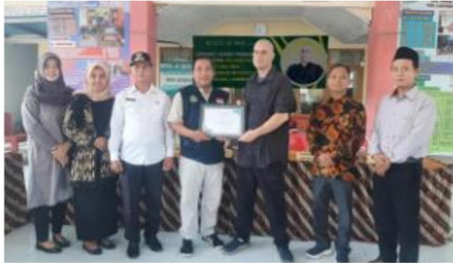
Gambar 2. Seminar dengan Pembicara Tim Layanan dari Luar Negeri dan Fakultas Ekonomi Unisla.

Selama kegiatan ini, pelaku usaha di Desa Jatirejo juga diberikan bimbingan dan masukan langsung oleh para pembicara yang telah berhasil memasarkan produk mereka ke berbagai lokasi. Salah satu arahan yang diberikan adalah pentingnya membangun jaringan bisnis untuk memperluas lokasi distribusi produk. Untuk mencapai lokasi tersebut, pelaku usaha harus memiliki jaringan yang luas untuk mendistribusikan produk mereka. Selain itu, para pembicara dalam seminar ini memberikan cara untuk membangun hubungan bisnis yang kuat dengan mentor, investor, pelaku bisnis, dan pemangku kepentingan lainnya. Jaringan bisnis adalah tentang menjalin koneksi dengan orang lain yang bekerja di bidang yang sama.